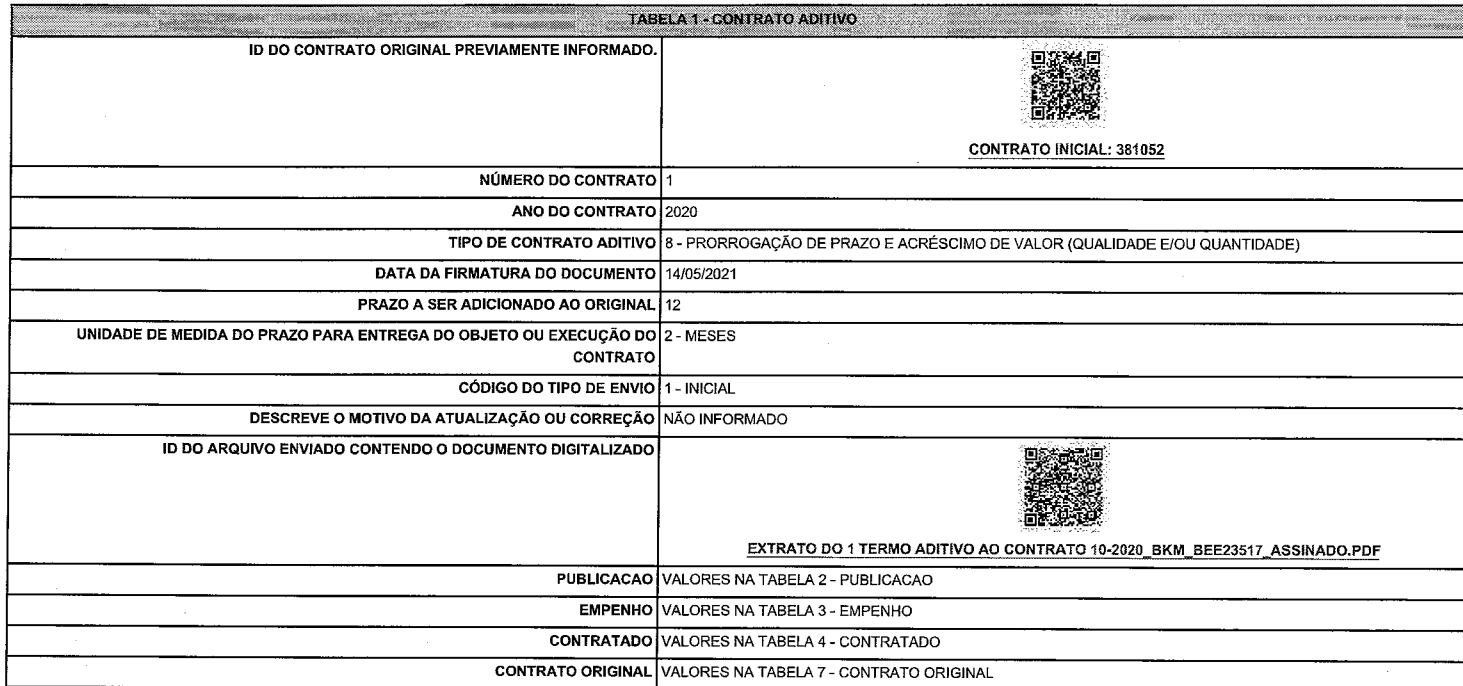
TABELA 1 - CONTRATO ADITIVO

ENTREGA DE RECIBO CÓDIGO: 9e18cdf1-0025-4faa-9a38-1e279f4284d8