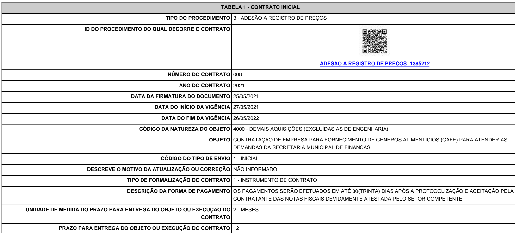
TABELA 1 - CONTRATO INICIAL

PRESTAÇÃO DE CONTAS LICITAÇÕES, DISPENSAS E ADESÃO A REGISTRO DE PREÇOS LAYOUT CONTRATO INICIAL DATA DA ENTREGA 28/05/2021 RECIBO 106464a9-f6ba-4063-be71-73ec60ab185e