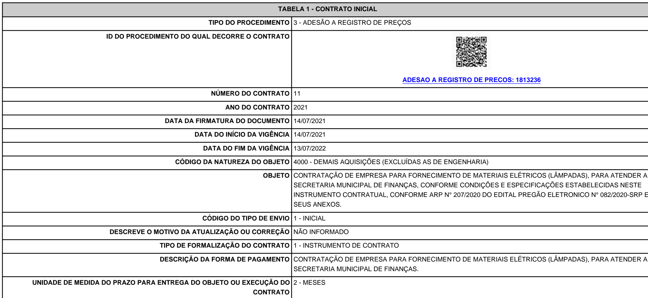
TABELA 1 - CONTRATO INICIAL

RECIBO 41fca16e-debb-4980-9bac-ce166981cb4d