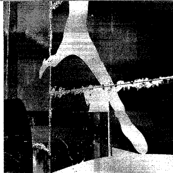
Desgastes na plotagem na ala direita da fachada frontal.