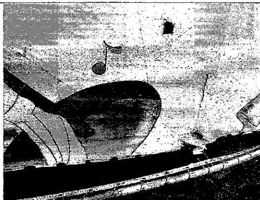
A lona da fachada traseira se encontra rasgada.