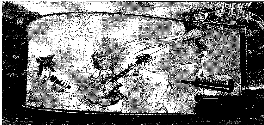
Fachada lateral apresenta desgaste na coloração artística.

Avenida Contorno com Avenida Independência S/N Setor Central Goiânia – GO. CEP: 74055140 – Tel.: 55 62 3524-7281