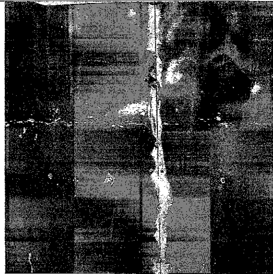
Detalhes na plotagem na ala esquerda da fachada frontal.

Avenida Contorno com Avenida Independência S/N Setor Central Goiânia – GO. CEP: 74055140 – Tel.: 55 62 3524-7281