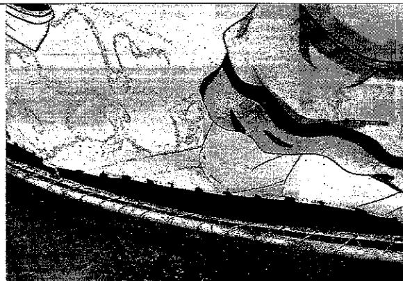
A lona da fachada traseira se encontra se fixação.