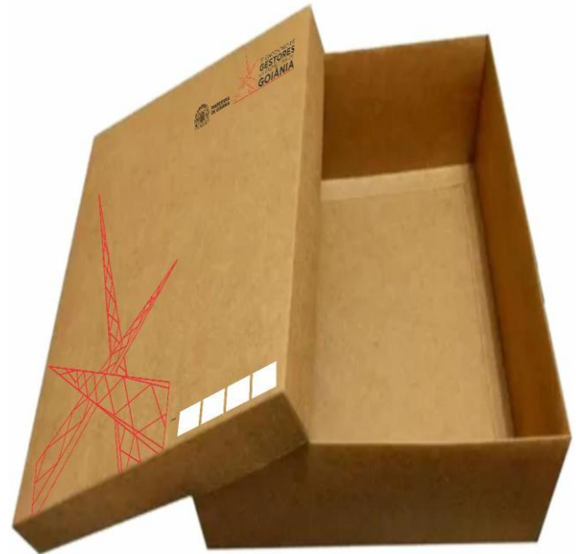
IMAGEM CAIXA PARA CAMISA