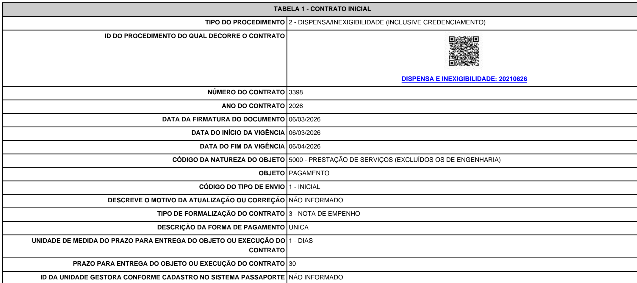
TABELA 1 - CONTRATO INICIAL

RECIBO af2e7783-9095-4b2e-a05f-ba2e57e872b4