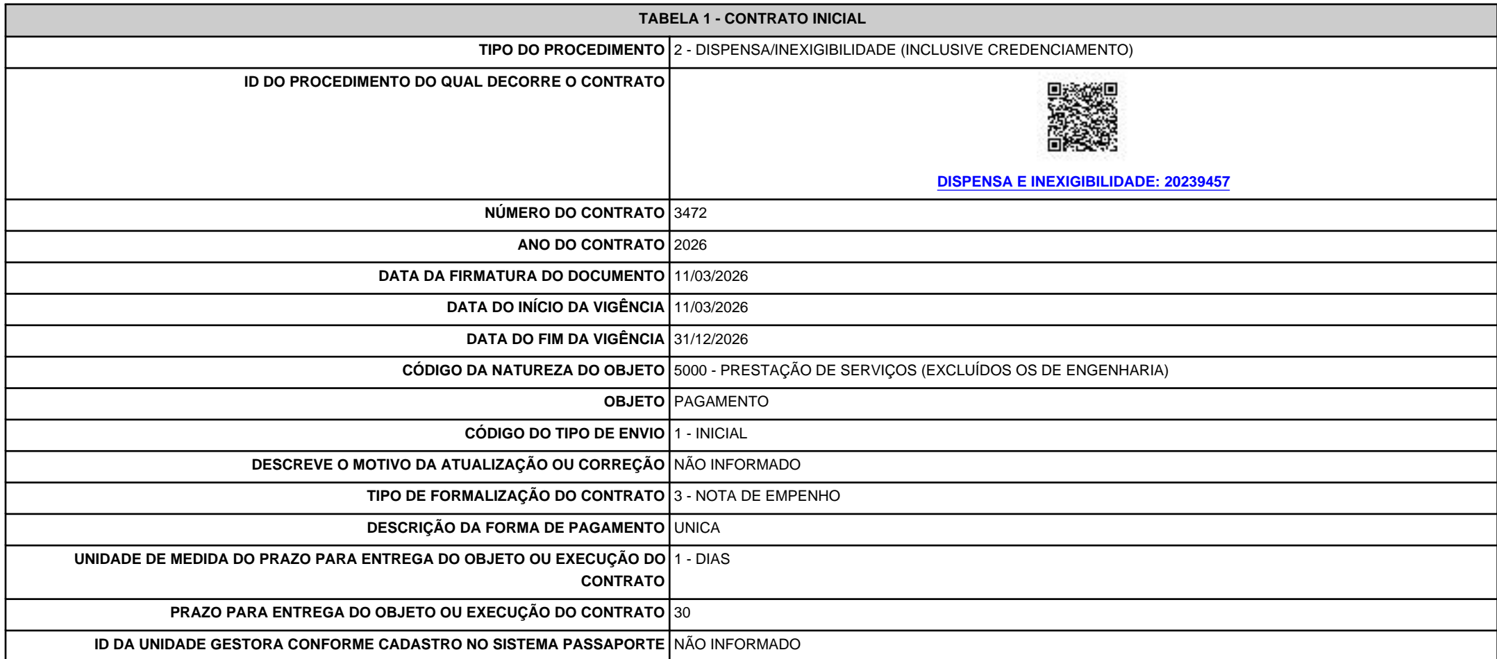
TABELA 1 - CONTRATO INICIAL

RECIBO d20dd8dc-23ae-4398-9c50-9ef06a92f92e