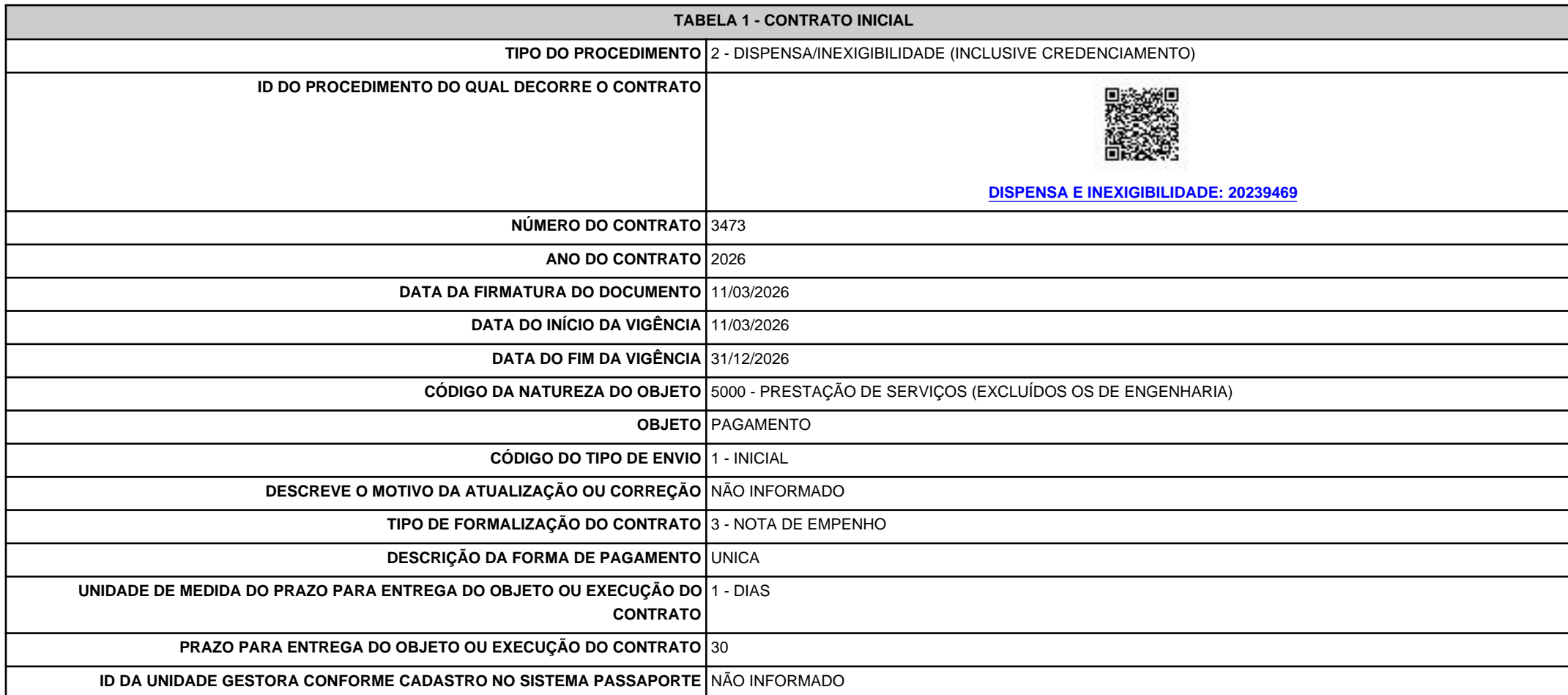
TABELA 1 - CONTRATO INICIAL

RECIBO a759eedc-cb11-477a-b6d3-9a1daee8accb