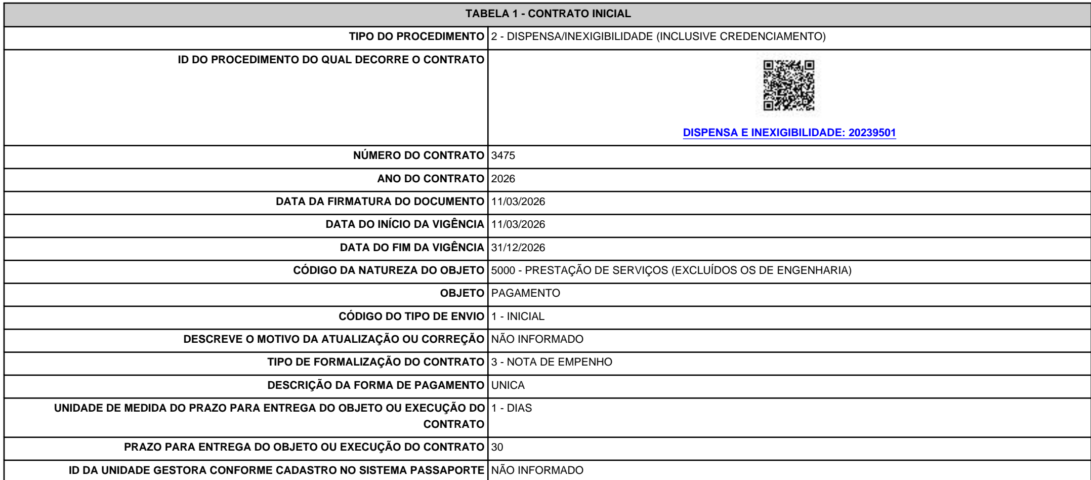
TABELA 1 - CONTRATO INICIAL

RECIBO 09b75012-af1c-4082-b428-282e3498640b