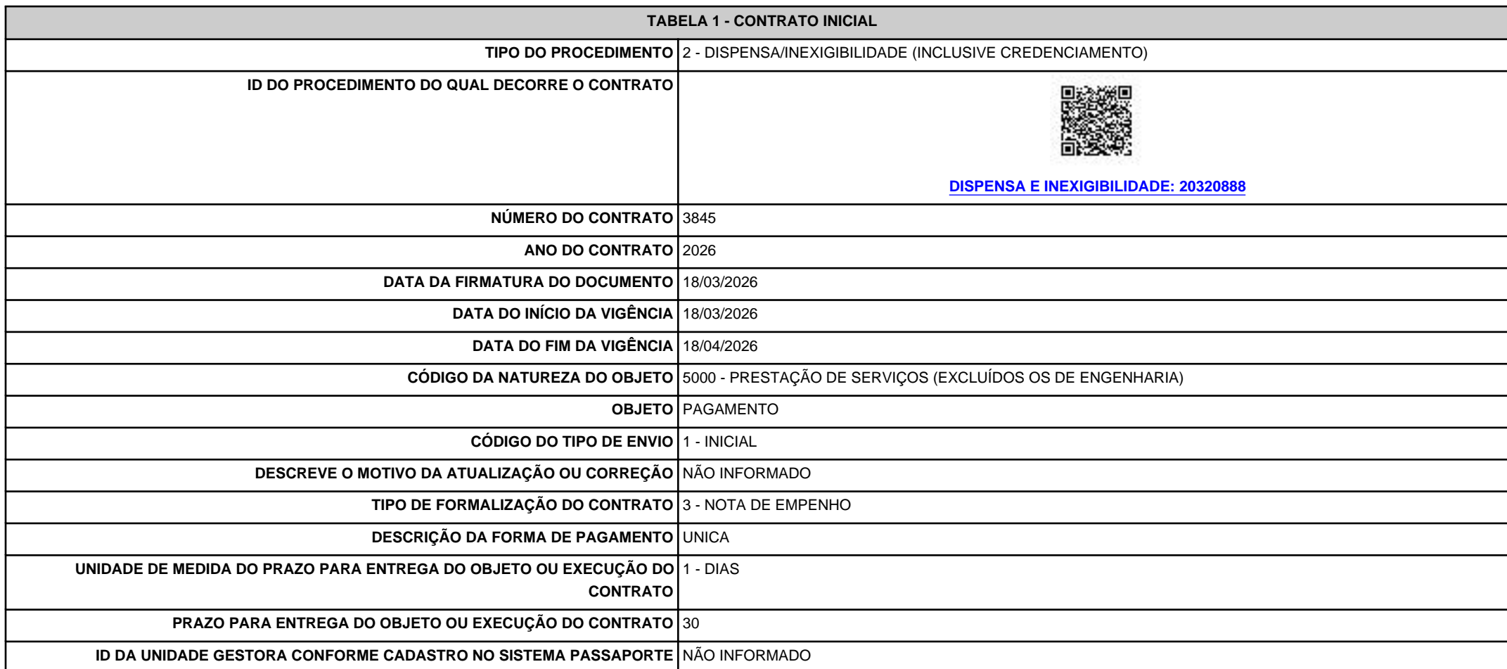
TABELA 1 - CONTRATO INICIAL

RECIBO 250ebf26-d130-4ebf-a8af-581b50d2dc9c